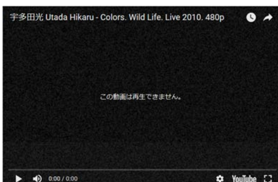
図2 図動画の再生に制限をかけられている動画