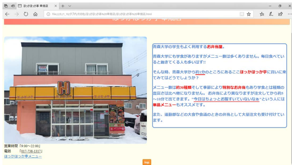
図 2 紹介ページ

それらが終わったらつぎに紹介ページを作成していく。紹介ページを作るにあたって写真や紹介文を載せることになるので、作る前にその店に行き許可を貰った。撮影してきた写真は HTML で角を削る加工をした。紹介文の表示では、CSS で文章の周りに囲み線を作り、強調したいところを赤文字や下線を引くなどした。画像の右下には営業時間や店舗の公式サイトリンクを貼った。最後に下の方にホーム画面に戻れるようにボタンを配置した