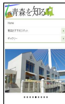
図 2.スマートフォンでの表示