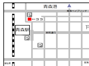
図 7.A-FACTORY の地図