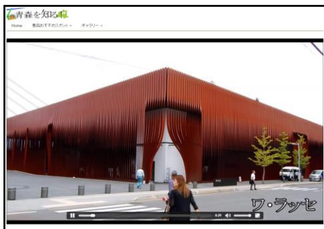
図 4.HP 上で動画を再生