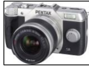
図 8.使用機材 1