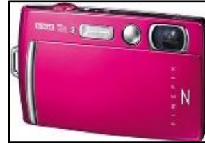
図 9.使用機材 2