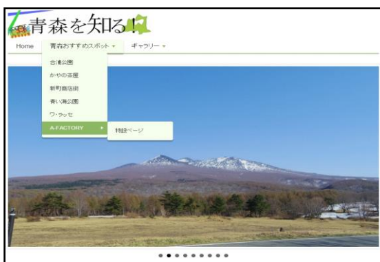
図 1.パソコンでの表示